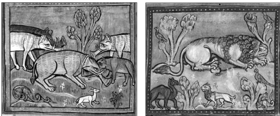
FIGURA 4.—Iluminaciones del Bestiario de Rochester (1225-1250)

sido convertidos por Escila en diversos animales: «Ya lo miro, y ya lo reconozco / que hacéis el bosque cuadro del Bosco» (vv. 1895-1896). Calderón hace aparecer una harpía, un lobo, una serpiente, un león, un tigre, un gato montés, una urraca y un jabalí. La aparición de animales como el jabalí o el gato no nos sorprende, pero sí la mención de un león y un tigre, animales que en la época muy poca gente en Europa conocía. Lo más probable es que El Bosco tuviese referencias de estos animales gracias a las relaciones de exploradores y viajeros que visitaban África o Asia, mediante los bestiarios mitológicos medievales —como el de Cambridge o el de Rochester— o a través de los libros de alquimia.