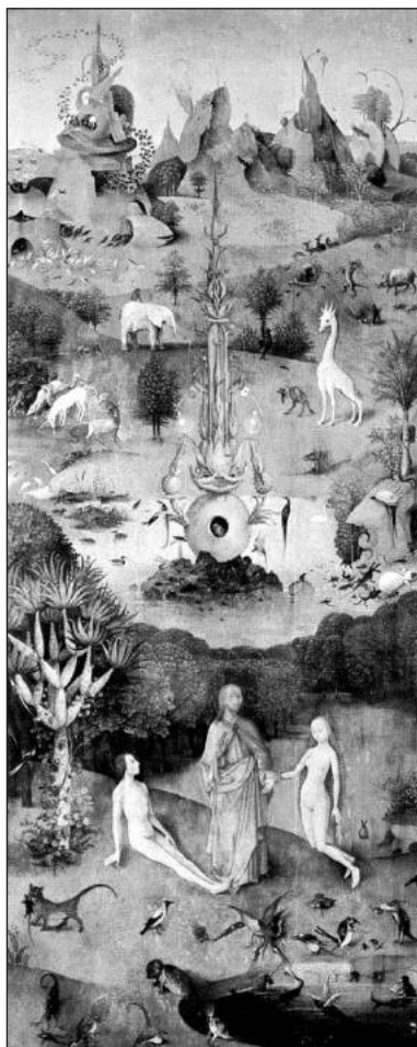
FIGURA 5.—Tabla izquierda (El Paraíso) del tríptico El jardín de las delicias

duda de impactarle y de quedar grabada en su memoria, y quizá pensando en esta obra, particularmente en los animales y los bosques de la tabla del Paraíso, imaginó la mojiganga de nuestra obra. Para Frederick de Armas EGDLS «es como si Calderón hubiese retorcido los poemas virgilianos para crear un mundo tan fuera de la realidad como el de las églogas romanas, pero mucho más atrevido y monstruoso. [...] Una fiesta que comienza con sutiles esbozos de égloga acaba como un cuadro diabólico o al menos como un frenesí báquico» 11 , como, efectivamente, un cuadro de El Bosco.