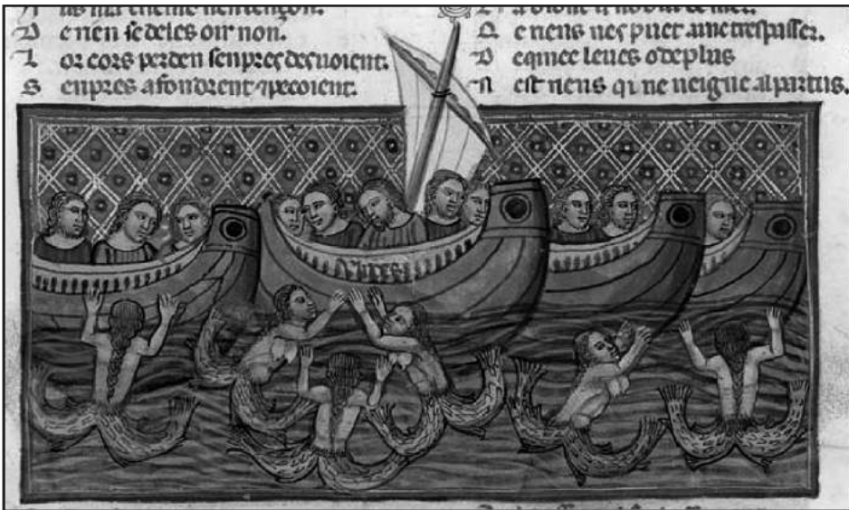
FIGURA 1.—Iluminación del Roman de Troie (1160-1170) de Benoît de Sainte-Maure