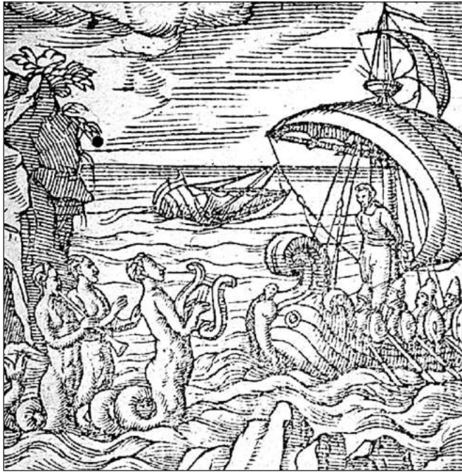
FIGURA 3.—Emblema CVX del Emblematum liber de Andrea Alciato

en el incendio que en 1734 asoló el Real Alcázar. La fiera, el rayo y la piedra se desarrolla en espacios muy parecidos a los de EGDLS y también arranca su acción en la playa y con la amenaza de un naufragio. Estas similitudes llevan a Shergold a considerar que gran parte de la escenografía empleada para EGDLS debió de ser muy parecida a la utilizada cinco años atrás para La fiera, el rayo y la piedra .